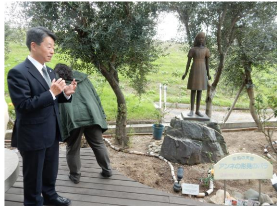
アンネフランクのバラ園見学風景